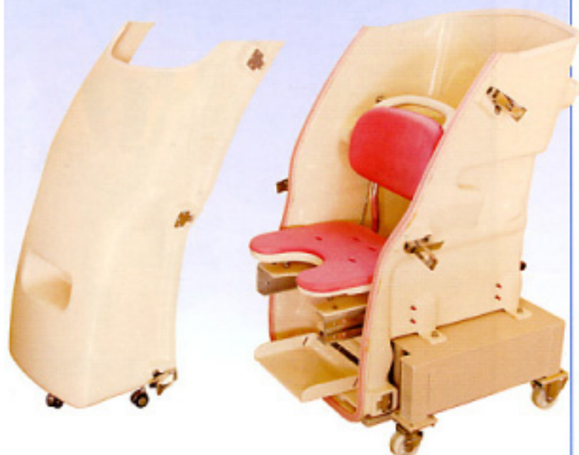
※オプションでキャスターなしの 転入置き型にもできます。